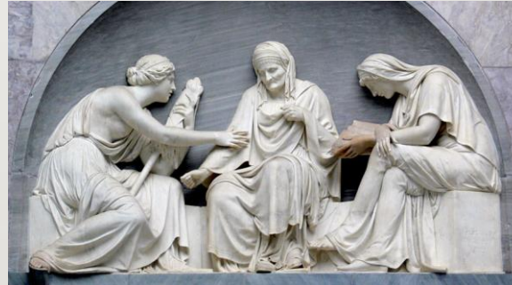
Podczas epoki baroku bardzo popularne były płaskorzeźby. Oto przykładowa.