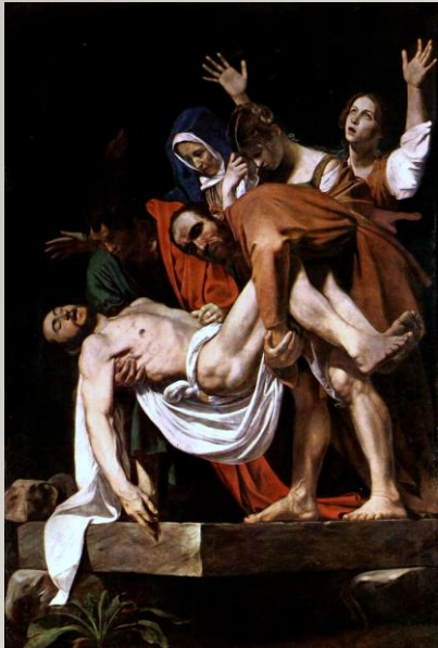
„Złożenie do grobu” to obraz włoskiego artysty Caravaggio. Widać na nim zastosowanie techniki światła i cienia.