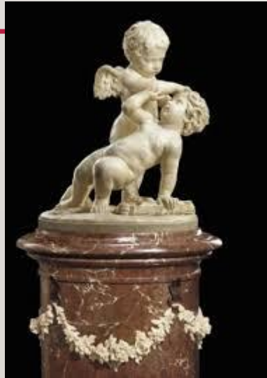
Cechą barokowych rzeźb były widoczne emocje i ruch.