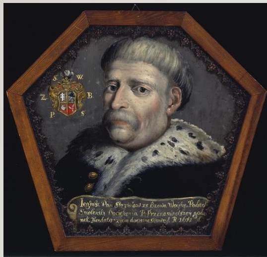
Muzeum Narodowe w Warszawie