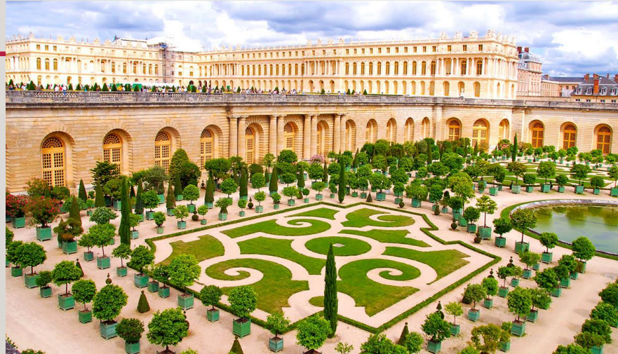
Pałac w Wersalu pod Paryżem powstał w epoce Baroku jako siedziba królów Francji. Zamieszkiwało ją kilkanaście tysięcy osób. Budowla jest imponująca i do dziś robi wrażenie.