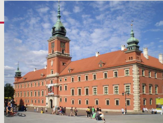
Zamek królewski w Warszawie to przykład polskiej architektury barokowej.