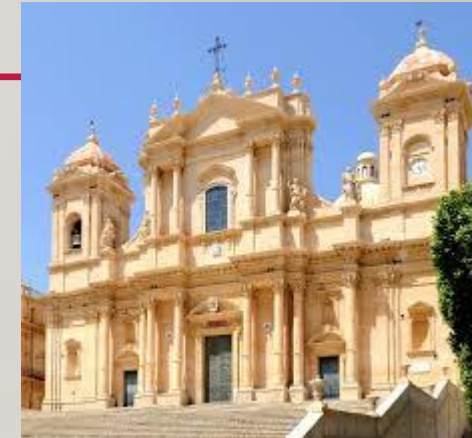
Większość budowli epoki Baroku przetrwała do dziś w nienaruszonym stanie!