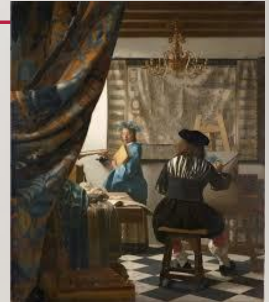
Obraz „ Alegoria malarstwa ” to jedno z dzieł sztuki epoki baroku.