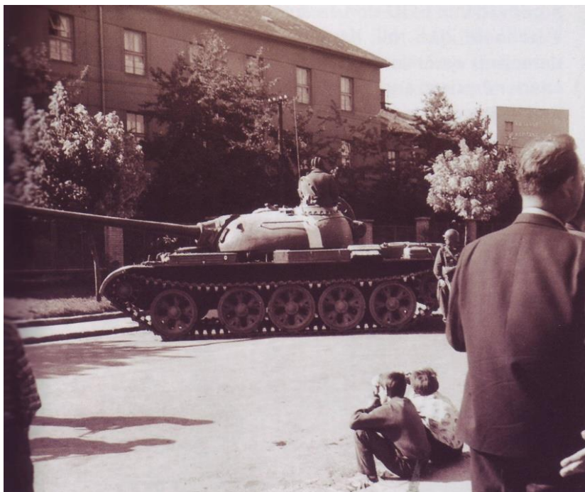
Spojenecké vojská v roku 1968 prišli aj do Nového Mesta nad Váhom.

Sovietske vojská zostali v Československu 21 rokov.