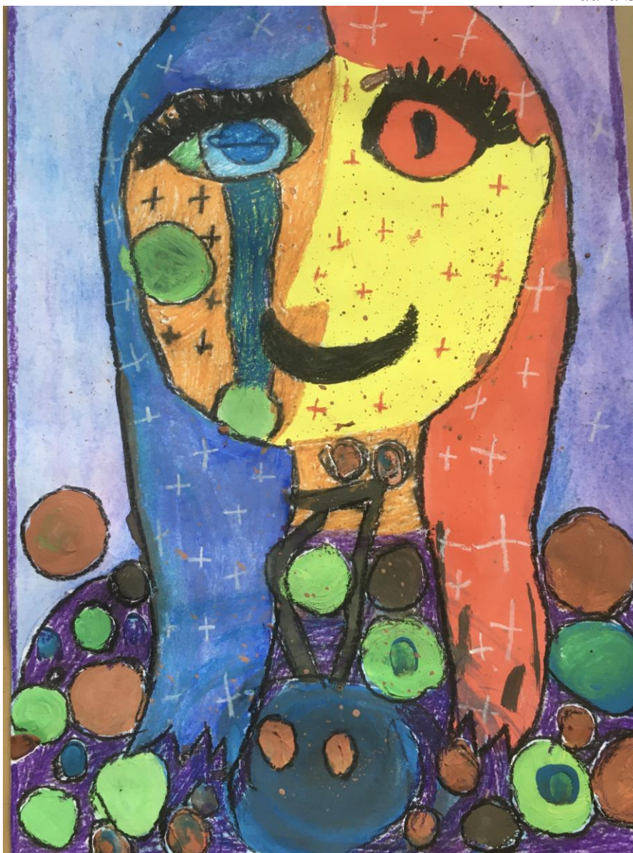
Obrázok 5, Slaninková Nikola, 9.A