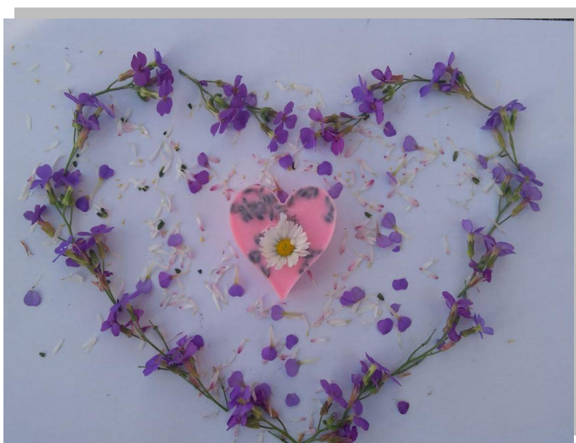
Obrázok 1, Verešová Simona