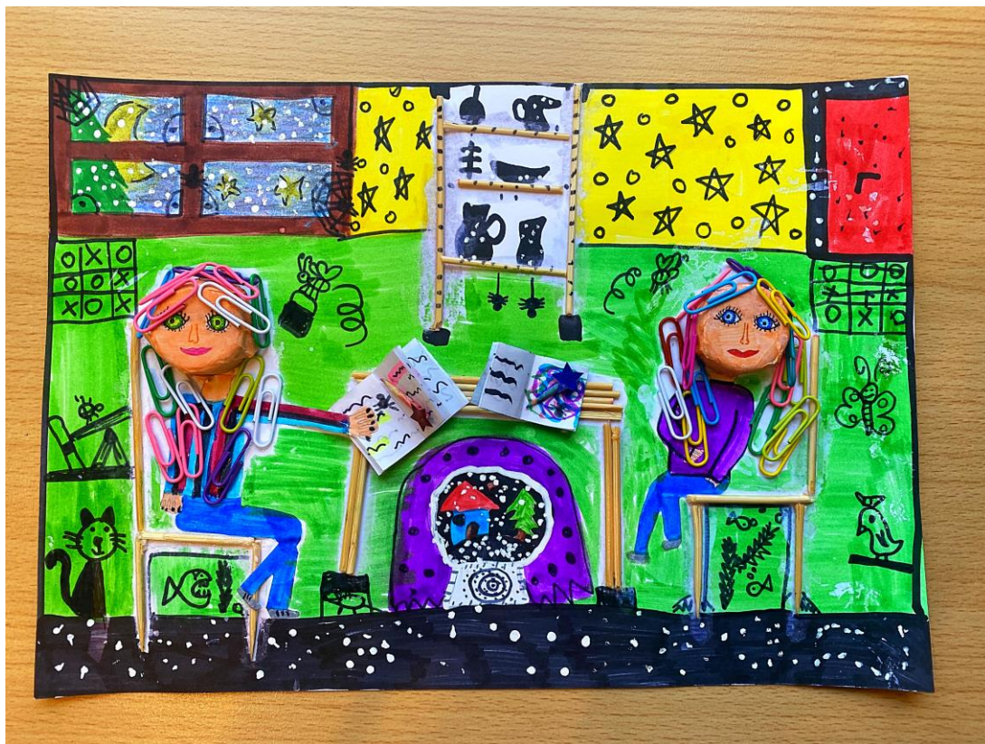
Obrázok 7, Jamrichová Michaela, 5.A