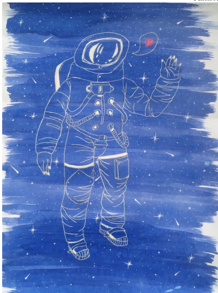
Obrázok 4, Várošová Laura, 9.B