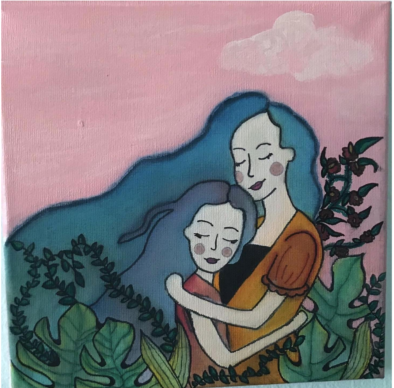
Obrázok 6, Slaninková Nikola, 9.A